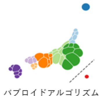
パブロイドアルゴリズム